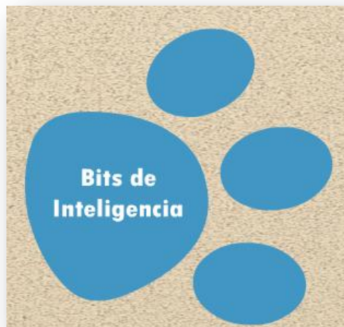
Figura 2. Botón para acceder a los bits de inteligencia