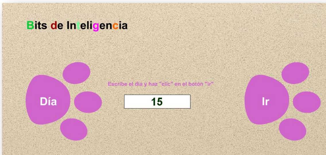
Figura 3. Pantalla para seleccionar el día que deseamos visualizar

En el cuadro de texto tecleamos el día que deseamos visualizar y pulsamos sobre el botón Ir .